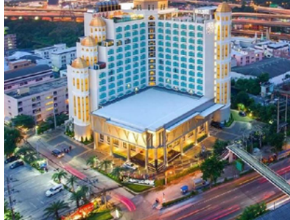
Al Meroz Bangkok (hôtel Halal)