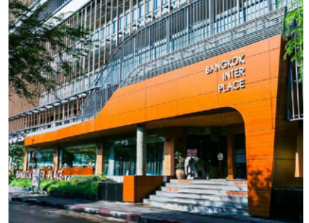
Bangkok Inter Place